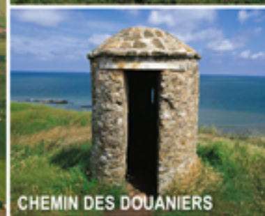
CHEMIN DES DOUANIERS