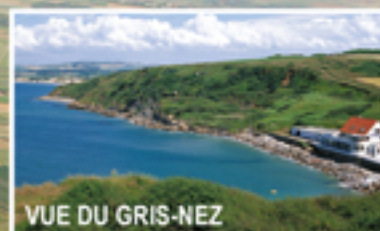
VUE DU GRIS-NEZ